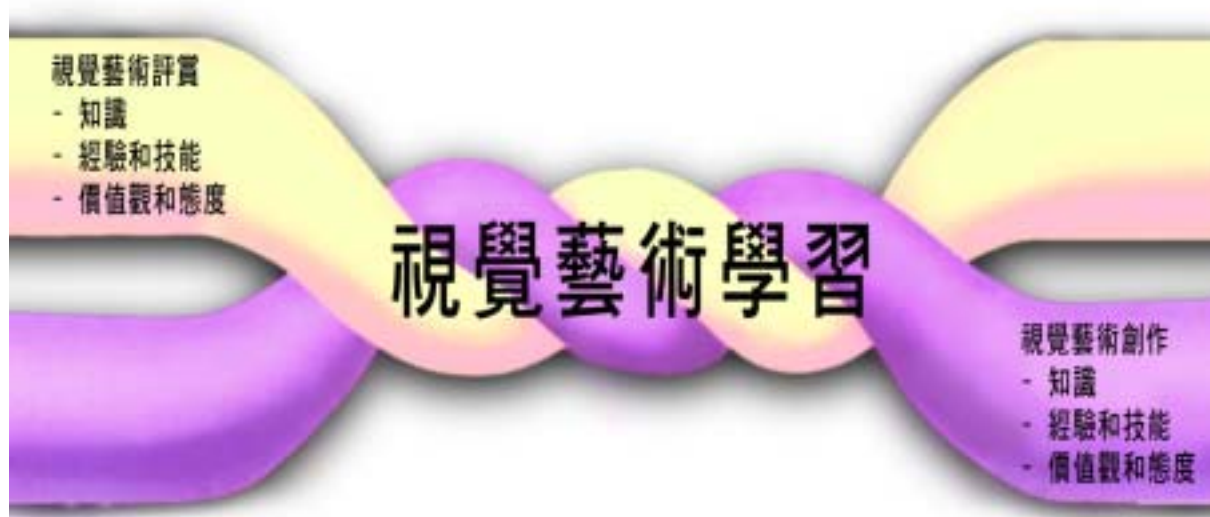
圖2.2 視覺藝術科的兩個學習範疇

視覺藝術科課程可以使學生建構出範圍廣闊的知識，例如對事實及資料的了解、概念、實踐知識、個人信念、視點、領悟；掌握經驗及技能；以及培養價值觀和態度。學生可以透過一個結合了 視覺藝術評賞 和 視覺藝術創作 兩個交錯纏結的範疇的均衡課程，來學習藝術。由於這兩個範疇的關係十分緊密，因此須以綜合統整的方式學習。圖2.2展示這兩個學習範疇的關係。