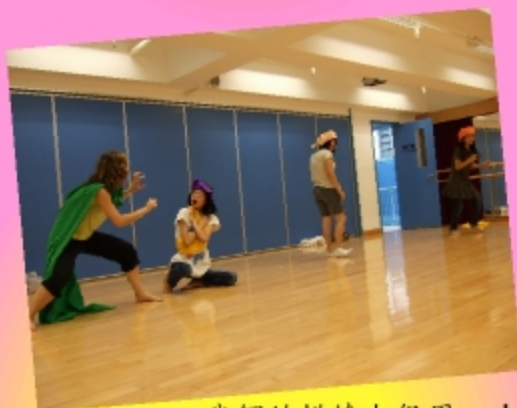
我們的排練也很用心！