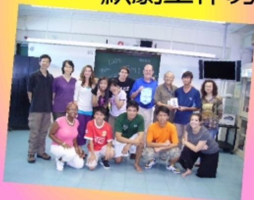
我們與美國QUEST聾人劇團的一班導師合照。