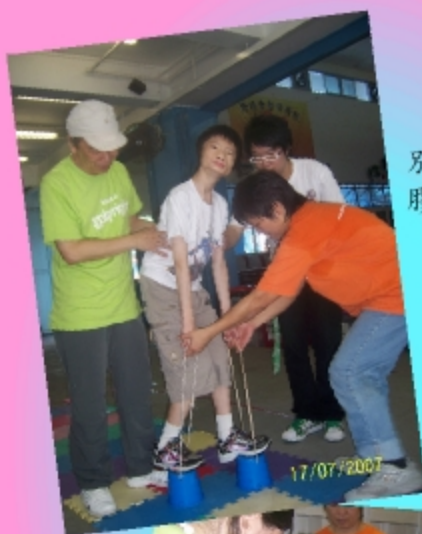
別小看這兩個膠桶， 膠桶真好玩。