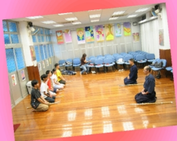
我們靜心的聽老師賜教。