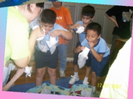
很有趣的吹泡泡活動。