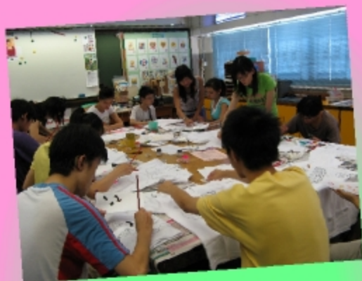
你看我們多用心設計 T-shirt !