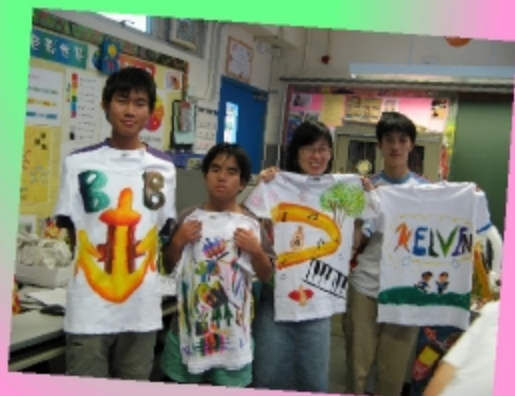
哈哈！我們的「傑作」，美不美？