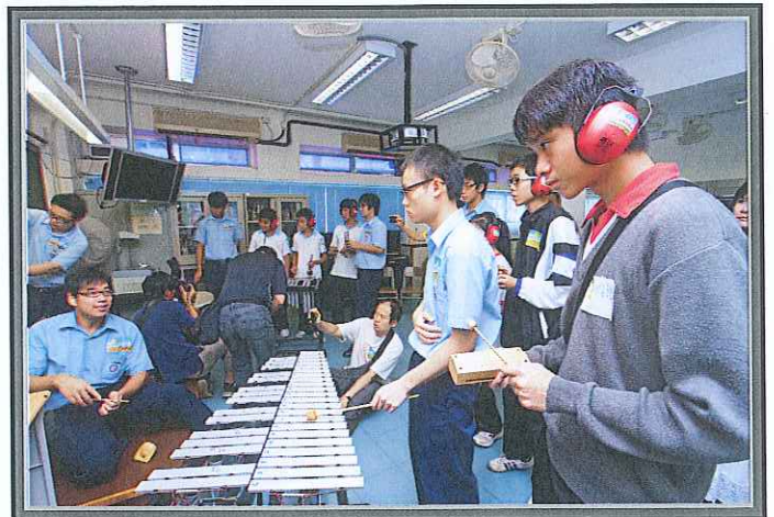
聽障學生只要用心學習及勇於嘗試，仍會感受到音樂課帶來的無比樂趣。