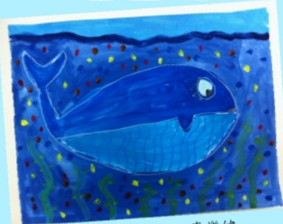
海洋 小六甲 李樂健