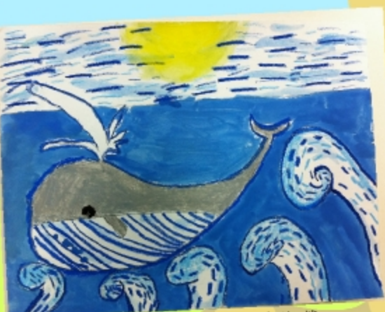
海洋 小六甲 曾俊榮