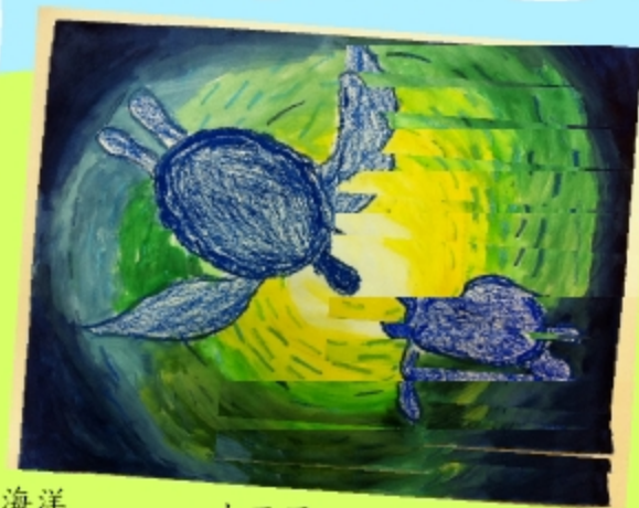
海洋 小五甲 鄭嘉豪